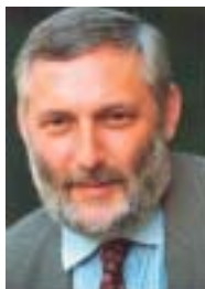
Dr. Franz Fischler

200 Jahre Musikkapelle Namlos! Das ist fürwahr ein großer Anlass, zu dem ich Euch als Präsident des Tiroler Blasmusikverbandes ganz herzlich gratulieren möchte!