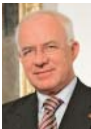
DDr. Herwig van Staa

Ich gratuliere der Musikkapelle Namlos herzlich zur Feier ihres 200-jährigen Bestehens sowie zur Widergründung vor 15 Jahren. Es erfüllt mich mit Stolz und Freude, dass es in einer relativ kleinen Gemeinde mit rund 100 Einwohnern eine so engagierte und erfolgreiche Musikkapelle mit 28 aktiven Mitgliedern gibt.